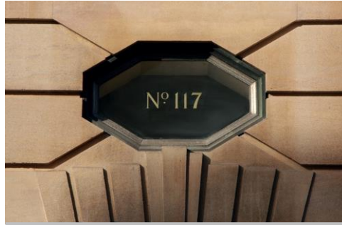
117 St Aldates Building