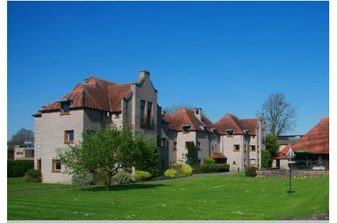
利德尔楼 (Liddell Building)

感谢您选择在此下榻。无论您是商务旅行、学习还是休闲旅游，我们专业而友好的团队都将致力于为您提供最高标准的服务。