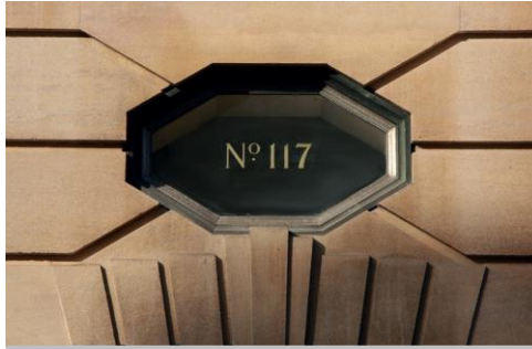
117 圣奥德楼 (117 St Aldates Building)